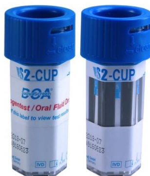
Reprodukce se může lišit od originálu!

Tento test poskytuje pouze předběžný analytický výsledek. Pro potvrzení předběžného pozitivního analytického výsledku by měla být použita specifitější alternativní chemická metoda. Preferovanými konfirmačními metodami jsou plynová chromatografie / hmotnostní spektrometrie (GC / MS), plynová chromatografie / tandemová hmotnostní spektrometrie (GC / MS / MS), kapalinová chromatografie / hmotnostní spektrometrie (LC / MS) nebo kapalinová chromatografie / tandemová hmotnostní spektrometrie (LC / MS / MS). Jakýkoli výsledek testu zneužívání drog, zejména pokud se jedná o předběžný pozitivní výsledek, musí být posouzen odborníkem. ulti med SalivaScreen Oral-Fluid Saliva Cup S2 je test na sledování terapeutických výsledků.